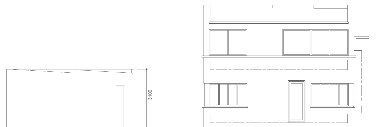
6 ÚTLIT VESTURHLIÐAR Scale: 1:100