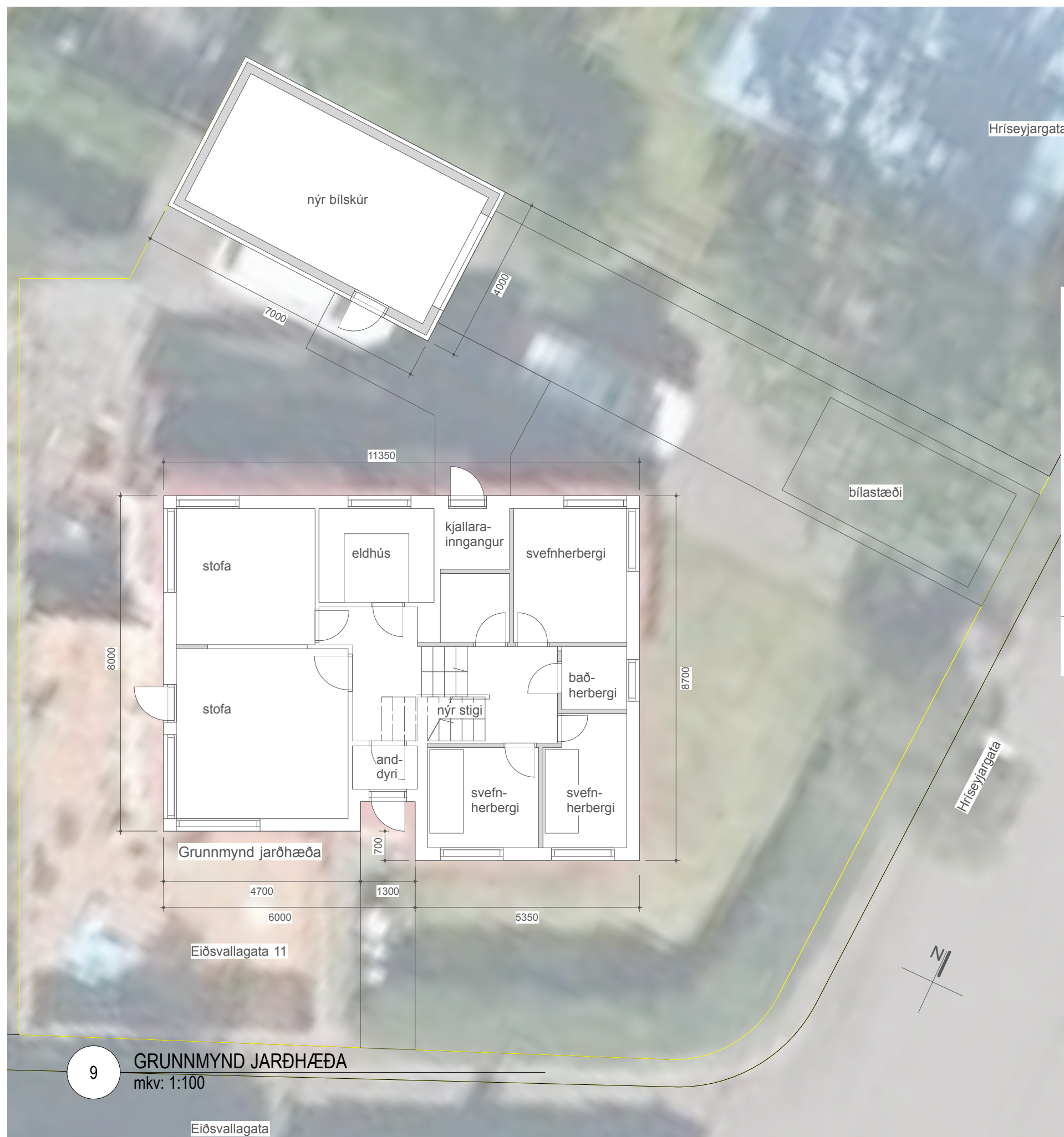
9 GRUNNMYND JARÐHÆÐA mkv: 1:100