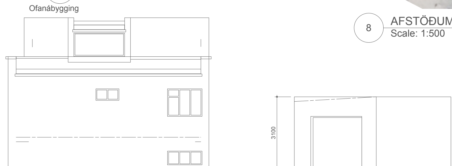
7 ÚTLIT AUSTURHLIÐAR Scale: 1:100